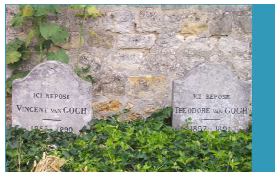
Vincent van Gogh is in bijzijn van zijn broer Theo van Gogh overleden. De dag na zijn overlijden is Vincent van Gogh begraven op de begraafplaats van Auvers-sur-Oise. Theo van Gogh is door zijn vrouw naast Vincent begraven. De klimop op de graven van de broers symboliseert de verbondenheid tussen de twee.

Het museum is een juweeltje, het is zeer goed gedaan. Er zijn veel originele voorwerpen geassocieerd met absinthe – glazen, lepels en fonteinen. Vergeet niet een kijkje te nemen in de tuin met heerlijk geurende planten. Er is ook een kleine cadeauwinkel.